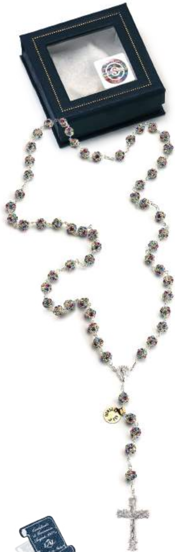
RA 082 Ø6