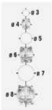
RA 001 Ø6