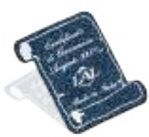
RA 202 Ø8