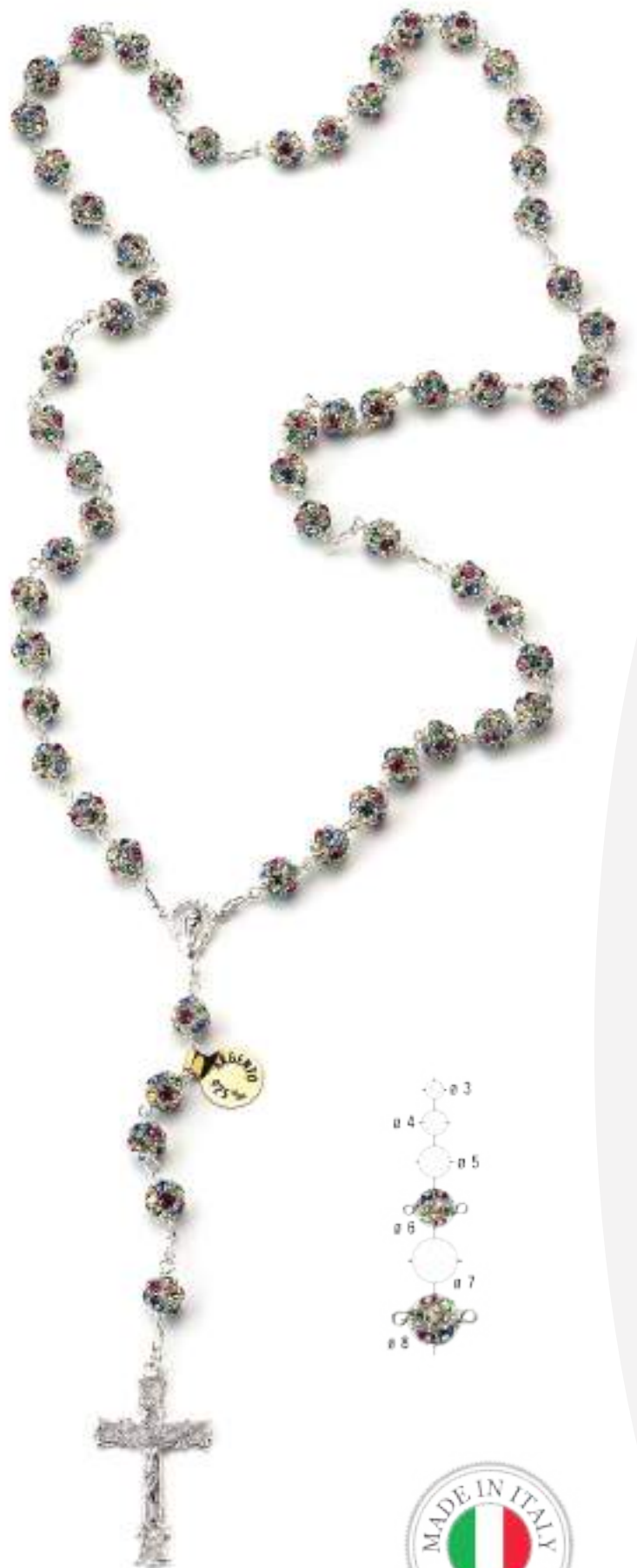
RA 083 Ø8